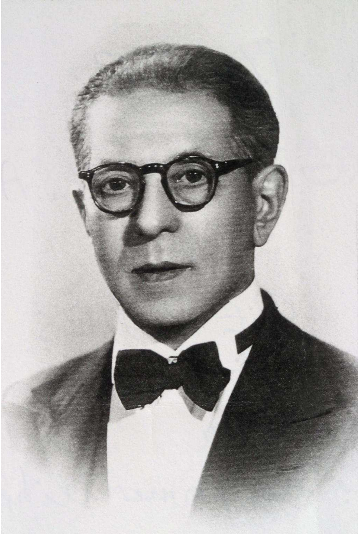
Retrat sense data, possiblement a finals dels anys 30.