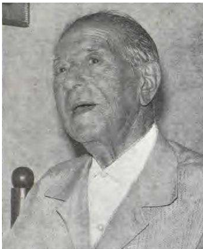
Imatge presa el dia que va rebre l'homenatge del poble de Santa Coloma de Farners, el 25 de setembre de 1971.