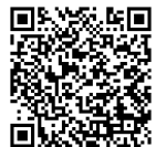
Manuscrit 02 (CEDOC - Fons Juli Garreta)