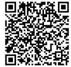
Manuscrit 01 (AMSG - Fons Josep i Arseni Roig)